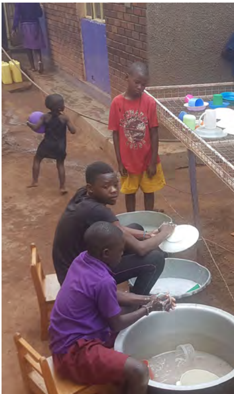
Als je klaar bent met eten, was je direct je bord af, want een ander kind staat te wachten om met dat bord te eten.