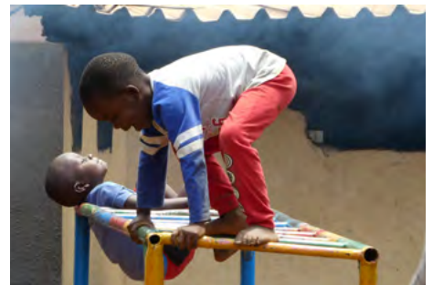
Klauteren kunnen ze allemaal.