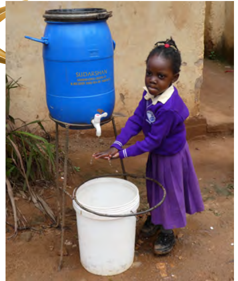
Leder kind leert direct de regels van de school. Hygiëne is erg belangrijk.