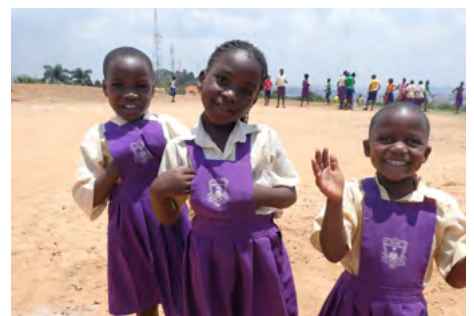
De kinderen zijn bijna altijd vrolijk en dankbaar.