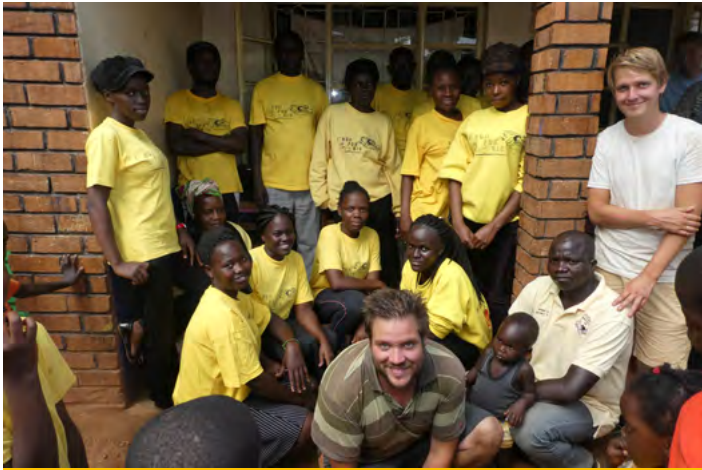
Alle leerkrachten dragen graag hun Run for Rio shirt. Zij zijn het zonnetje in huis.

Wij wensen u fijne feestdagen en een gezond 2019!