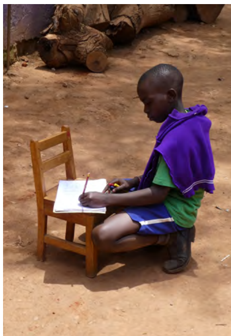
Als je met 17 andere weeskinderen op één kamer van 4 bij 5 meter slaapt, dan zoek je een rustige plek om je huiswerk te doen.